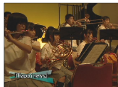
高校吹奏楽部演奏会

【インターネットご加入の方もこちらの放送をUBCホームページにてご覧いただくことが可能です。】 (議会放送を除く。現在実験放送中)