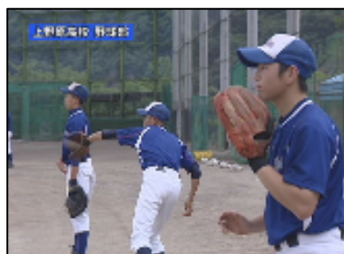
高校野球(山梨県予選)